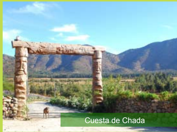
Cuesta de Chada