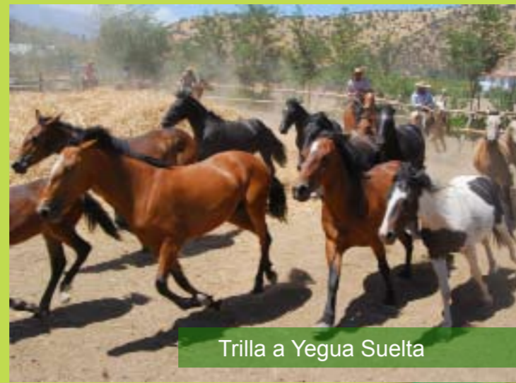
Trilla a Yegua Suelta