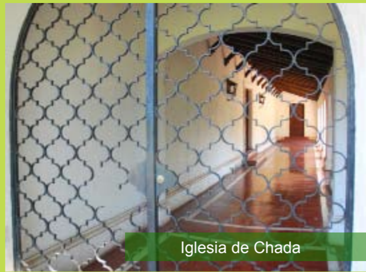
Iglesia de Chada