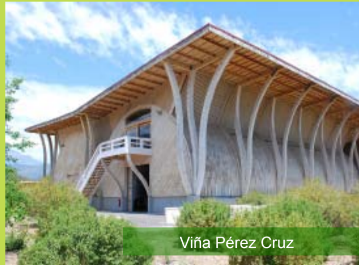
Viña Pérez Cruz