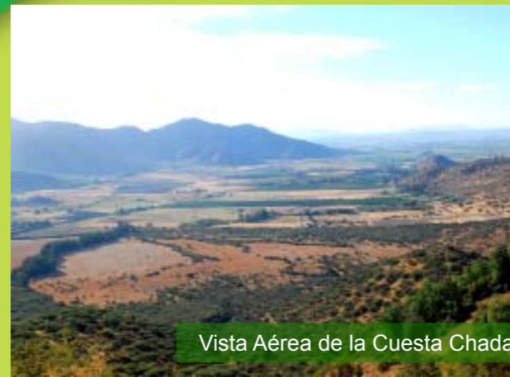
Vista Aérea de la Cuesta Chada