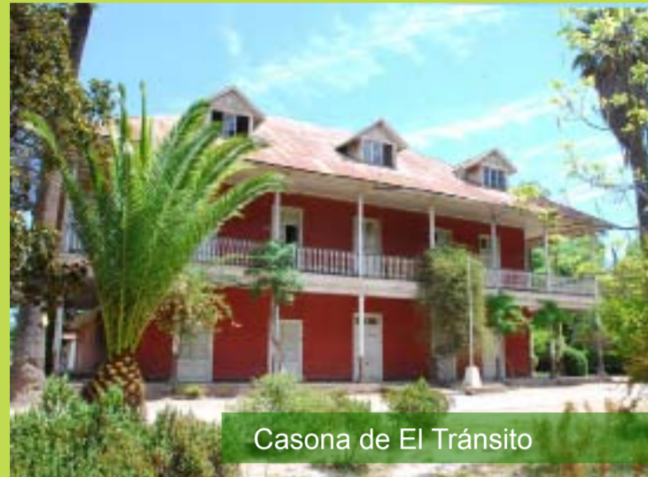
Casona de El Tránsito