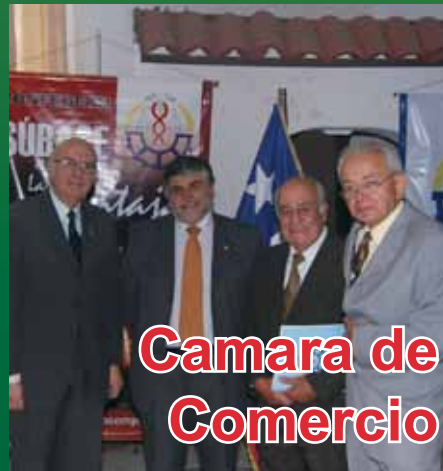
Camara de Comercio