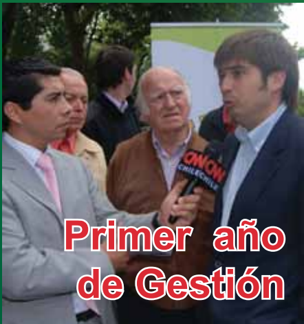
Primer año de Gestión