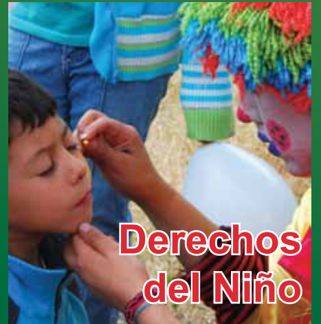
Derechos del Niño