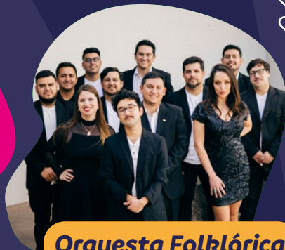
Orquesta Folklórica Nacional